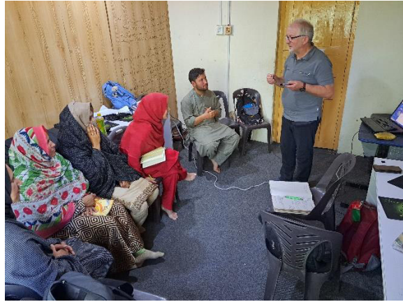
Lehrer - Aus- und Weiterbildung