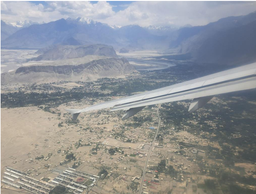
Anflug auf das 2.500 m hoch gelegene SKARDU