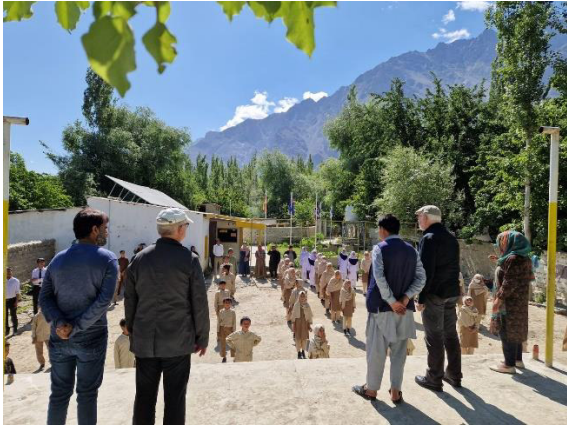
Ein Erlebnis, die 'lautlose' Opening Ceremony